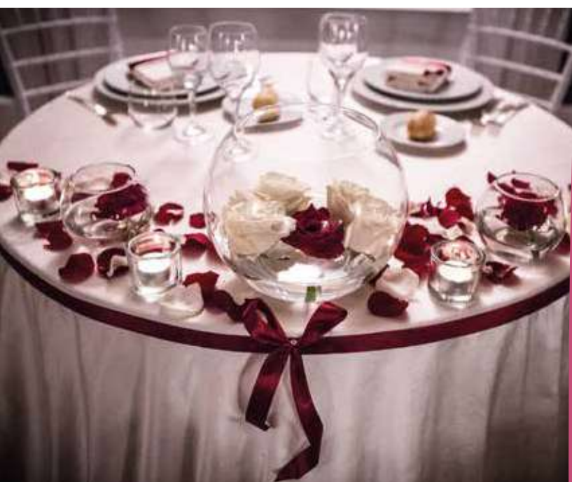
Tableau marriage e Menu ci pensiamo noi...